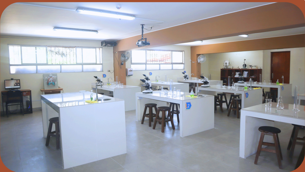
Laboratorio de ciencias - primaria