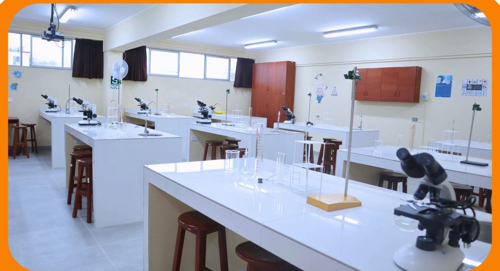
Laboratorio de ciencias - secundaria