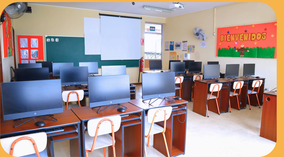
Aula de informática