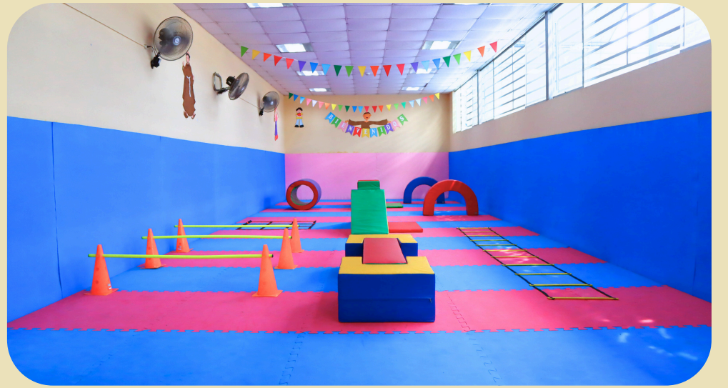
Aula de psicomotricidad