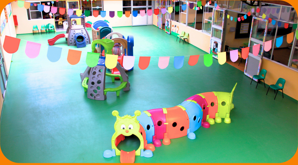
Patio de inicial